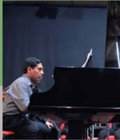
Solo de piano