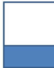
¼ Página 21 x 8 Formato JPG y 300 dpi